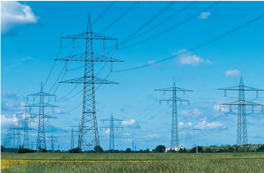
Das Höchstspannungsnetz transportiert Strom über weite Strecken